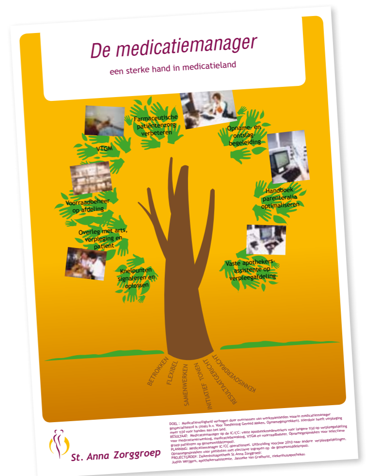
Poster winnaar 2009 ziekenhuisapothek

Op 19 november 2009 vond de jaarlijkse lunchbreak “Even tijd voor kwaliteit” plaats. Met deze dag willen we zoveel mogelijk medewerkers enthousiast maken voor kwaliteitsverbeteringen binnen het team of de afdeling en succesvolle initiatieven belonen met de kwaliteitsprijs