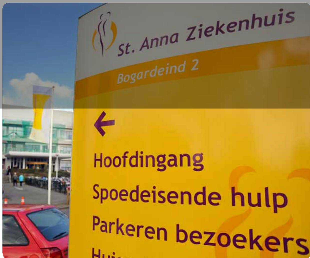
St. Anna Ziekenhuis, locatie Geldrop

Net als andere organisaties hebben wij te maken met steeds mondiger wordende en bewuster kiezende (potentiële) cliënten en patiënten, die een helder beeld willen van wat we te bieden hebben. Daarom hebben we in 2009 een bewust onderscheid gemaakt in onze activiteiten en gekozen voor een heldere segmentatie.