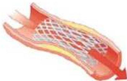
Doorsnede van slagader met daarin een stent.

Als de dotterbehandeling onvoldoende resultaat oplevert, kan er besloten worden een stent te plaatsen. Een stent is een dun metalen gaas in de vorm van een koker, dat wordt ontvouwen om de aangetaste slagader open te houden en de bloedstroom te herstellen. De stent blijft in de slagader zitten en groeit na verloop van tijd helemaal in de vaatwand in.