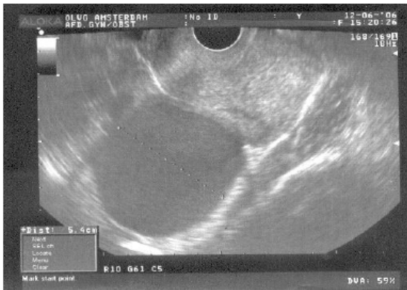
Figuur 2. Inwendige echoscopie bij endometriose: afgebeeld is een eierstok met endometriose (endometrioom) (stippellijn) naast de baarmoeder