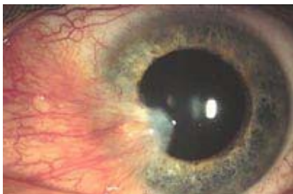
Figuur 1. Pterygium

Het betreft een groeiend weefsel. Bij de behandeling vindt ook bestraling plaatsvindt. Pterygium is echter géén kwaadaardige aandoening.